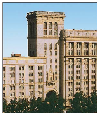
ФЕВРАЛЬ 2010 г. № 2 (85)

Сотрудники всего «Алмаза» – объединяйтесь!