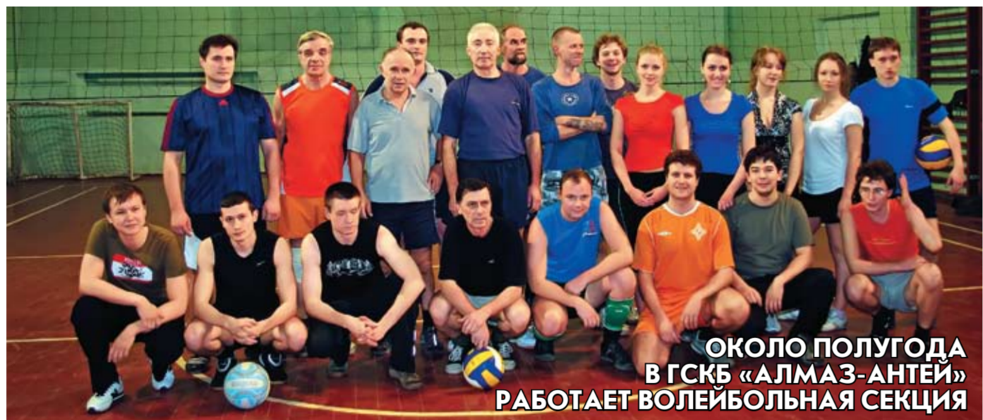
ОКОЛО ПОЛУГОДА В ГСКБ «АЛМАЗ-АНТЕЙ» РАБОТАЕТ ВОЛЕЙБОЛЬНАЯ СЕКЦИЯ